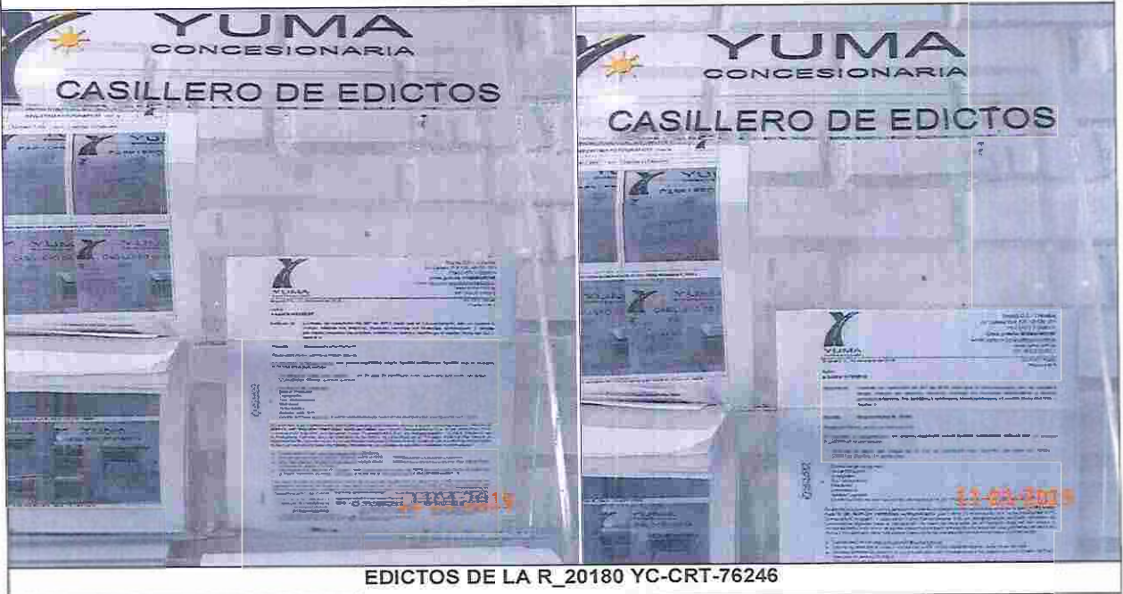
EDICTOS DE LA R_20180 YC-CRT-76246