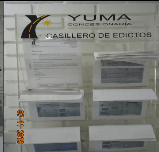
Edicto ubicado en la Oficina de Atención al Usuario fija