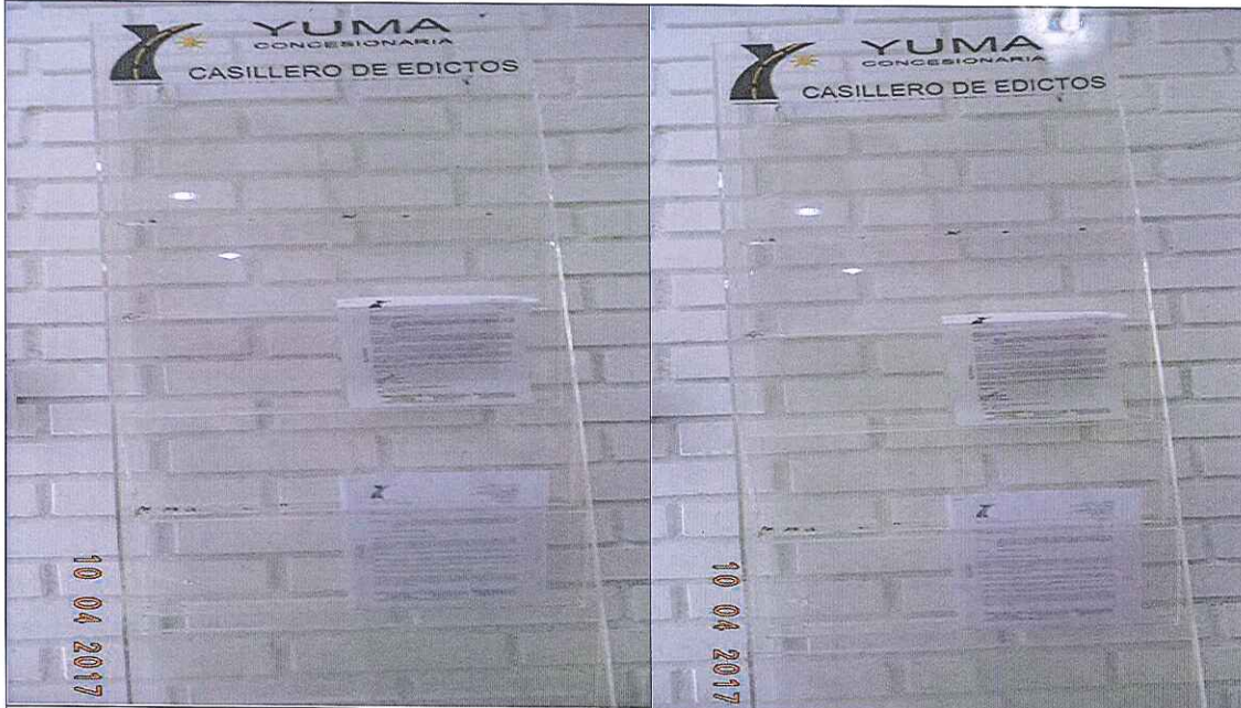
EDICTOS DE LA P_02818 YC-CRT-53316