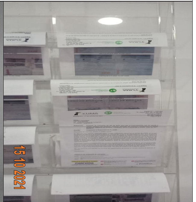
EDICTOS DE LA R_30966 YC-CRT-106833