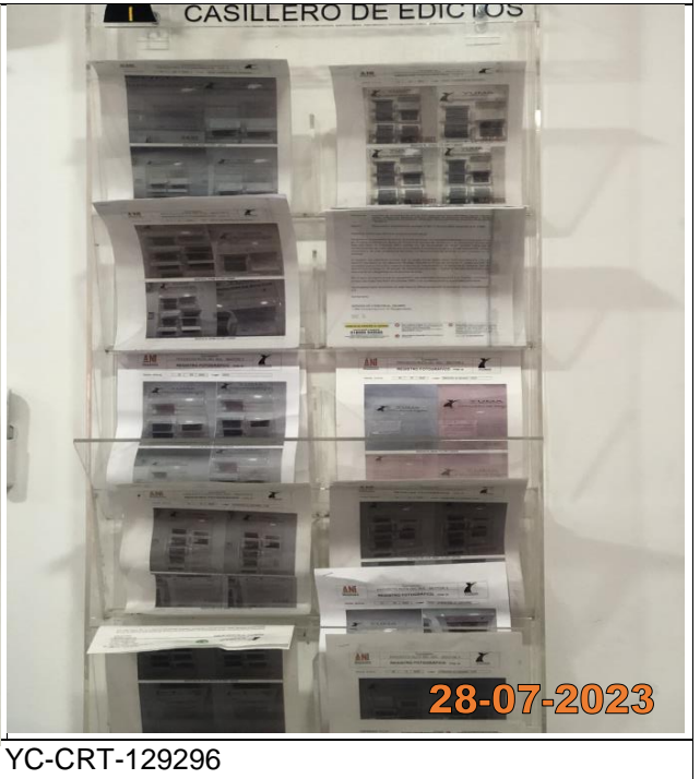
EDICTO R_37662 YC-CRT-129296