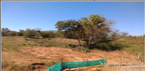
Fotografía No. 4 Fecha: 6/01/2023 Lugar: T6-H41-K0+830 Observaciones: Instalacion de proteccion y saco suelo