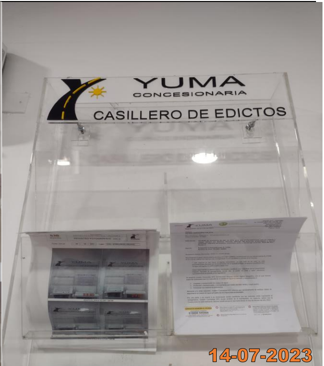
EDICTO R_37096 YC-CRT-129002