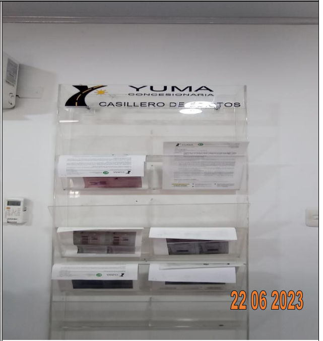
EDICTO R_36995 YC-CRT-127896