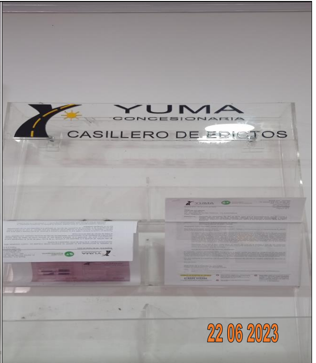
EDICTO R_36995 YC-CRT-127896