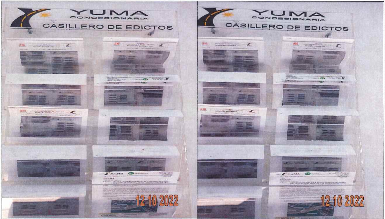
EDICTOS DE LA R_35614 YC-CRT-119845