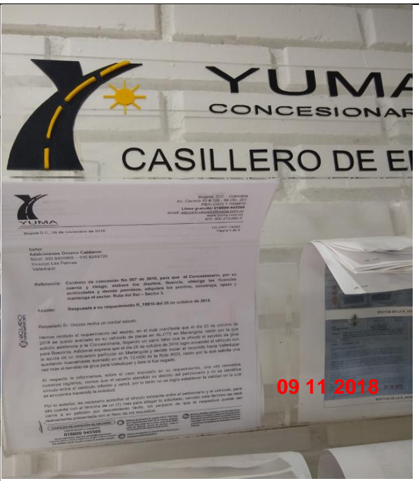
Publicación por edicto del comunicado YC-CRT-74283 Respuesta R_19915