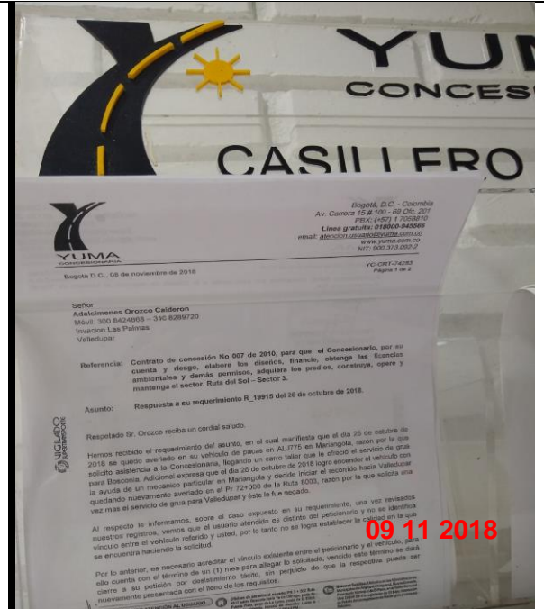
Publicación por edicto del comunicado YC-CRT-74283 Respuesta R_19915