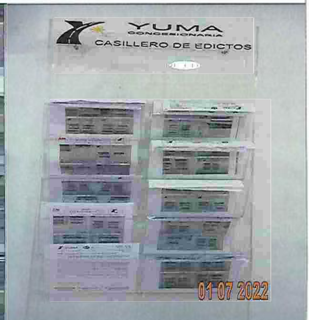
EDICTO R_34701 YC-CRT-116127