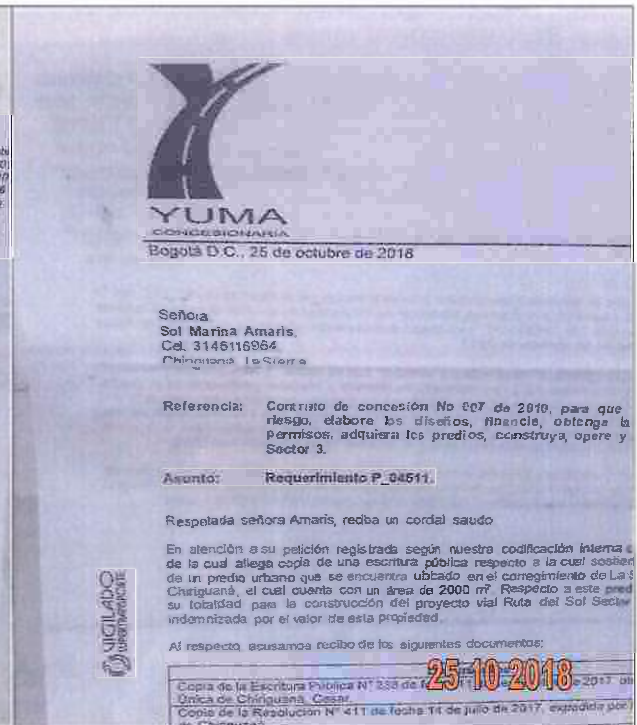
EDICTOS DE LA P_04511 YC-CRT-73345