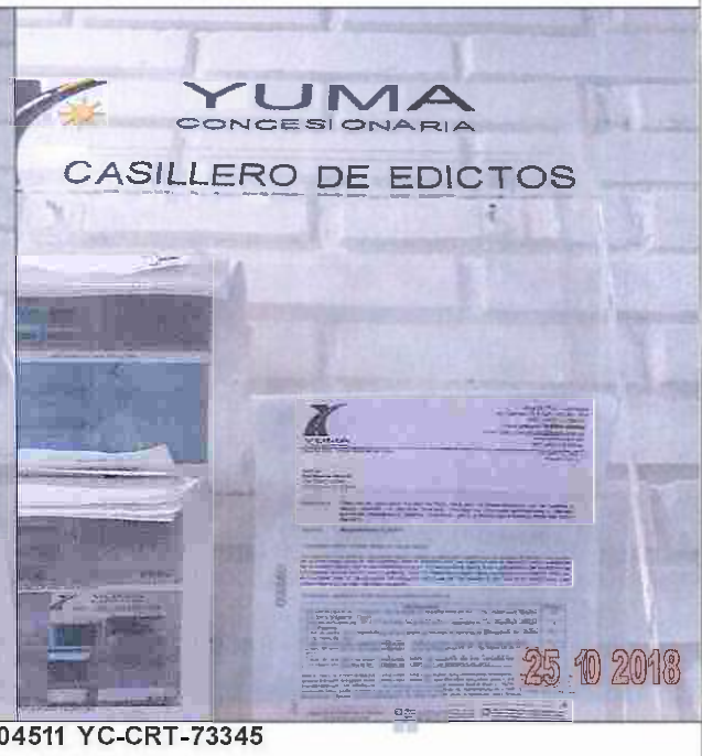
EDICTOS DE LA P_04511 YC-CRT-73345