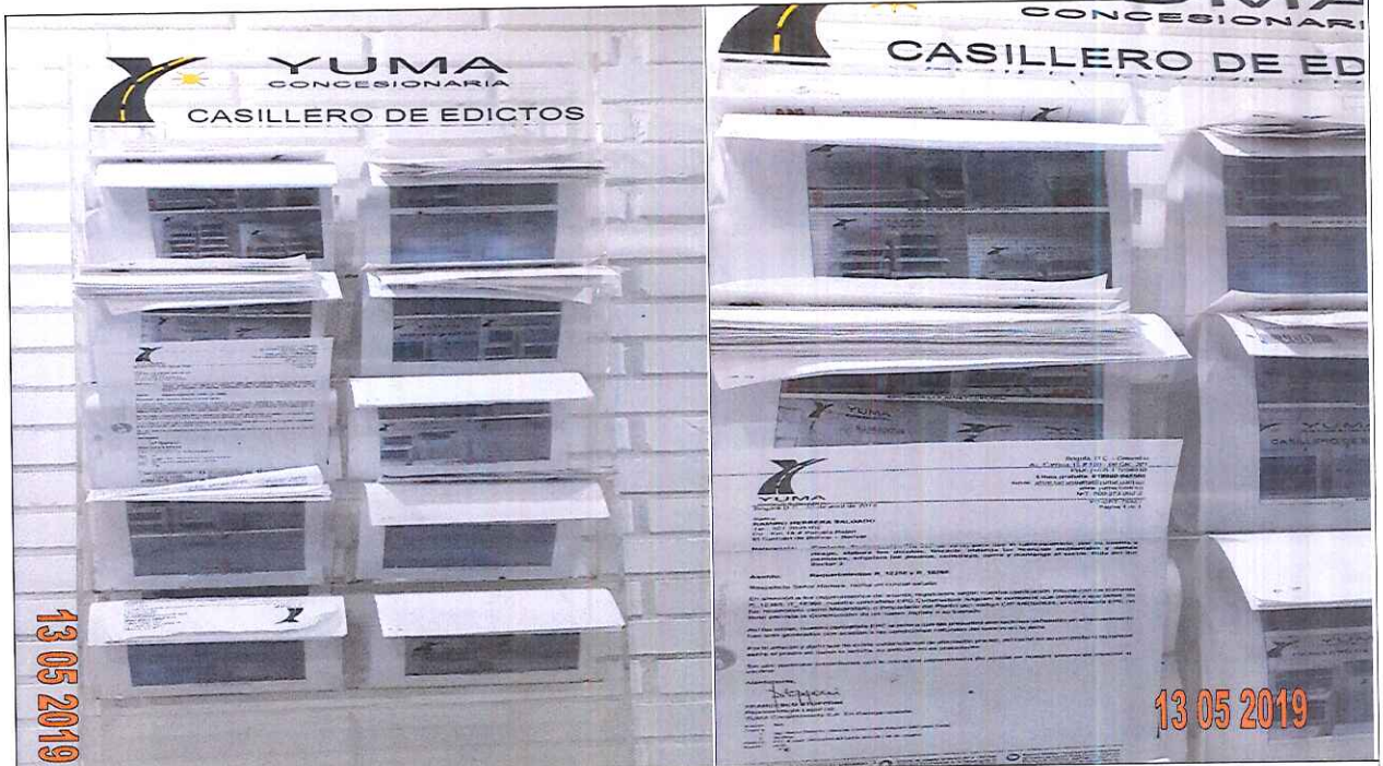
EDICTOS DE LA R_12358 R_18366 YC-CRT-79857

Oficina de Atención Al Usuario, Bosconia