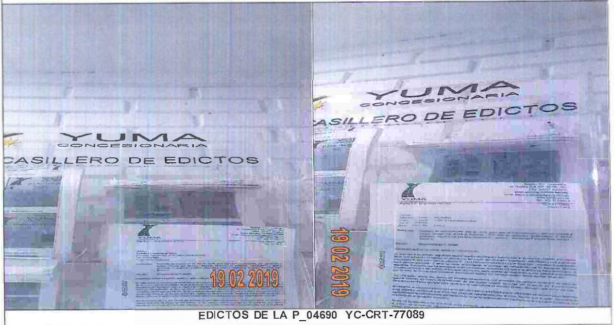
EDICTOS DE LA P_04690 YC-CRT-77089