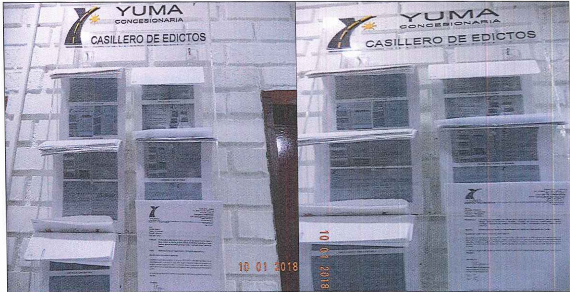
PUBLICACIÓN DE EDICTOS R_18520 YC-CRT-64164

Fecha: (d-m-a) 10 01 2017 Lugar Oficina de Atención al Usuario -CCO