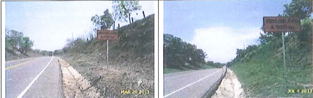
Señalización de aproximación: señal informativa de presencia de obra a 500 metros . Registro fotográfico inicial de instalación y a la fecha.