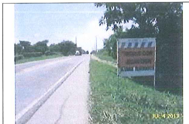
Señal de advertencia en el PR72+350 instalada a la salida de El Difícil desde el 28 de Noviembre de 2011.

Vale la pena precisar que toda la señalización instalada, cumple con lo establecido en el Plan de Manejo de Transito – PMT y en la normatividad vigente establecida para tales fines. A continuación, se adjunta registro fotográfico de la señalización que se ha implementado previo al inicio de las obras: