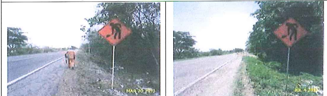
Señalización de aproximación: señal preventiva de obreros en la vía . Registro fotográfico inicial de instalación y a la fecha.