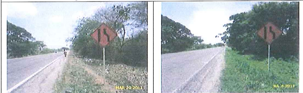
Señalización de aproximación: señal preventiva de reducción de carril a la izquierda . Registro fotográfico inicial de instalación y a la fecha.